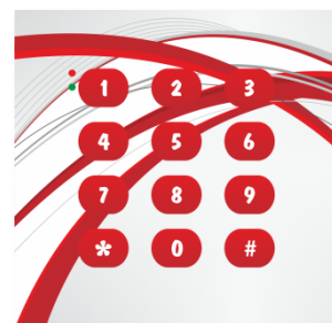
EQU-R153.X nadruk dowolny (przykładowy wzór)*