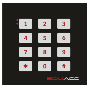
EQU-R153.C nadruk czarny