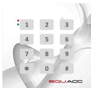
EQU-R153.J nadruk jasnoszary