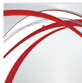
EQU-R161.X nadruk dowolny (przykładowy wzór)*

* Poprawnie przygotowany plik wzoru nadruku powinien mieć wymiary 90x90 mm (format brutto). Widoczny obszar netto 86x86 mm. Spad wynosi po 2 mm dla każdego z boków projektu. Preferowane formaty plików to PDF, TIFF, PSD, JPG. Kolorystyka CMYK. Położenie diody LED (czerwony punkt na wizualizacji) pozostaje niezmiennie.