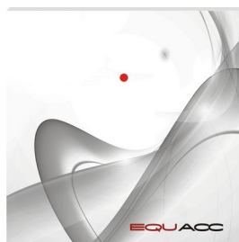
EQU-R161.J nadruk jasnoszary